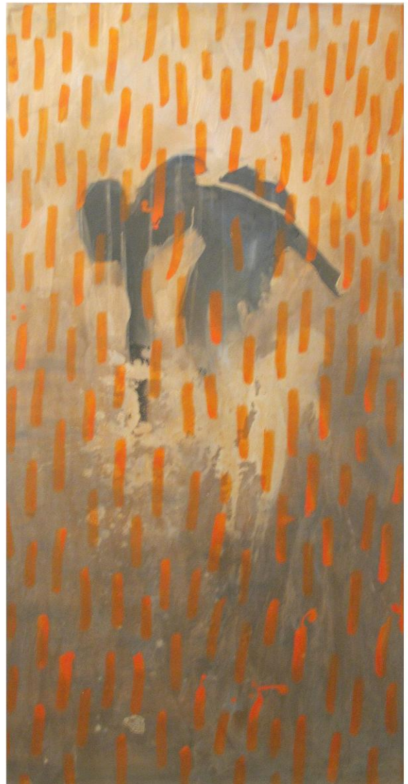
Kurt Ebbers , "Muschelsucher", 200 x 105 cm, 2008