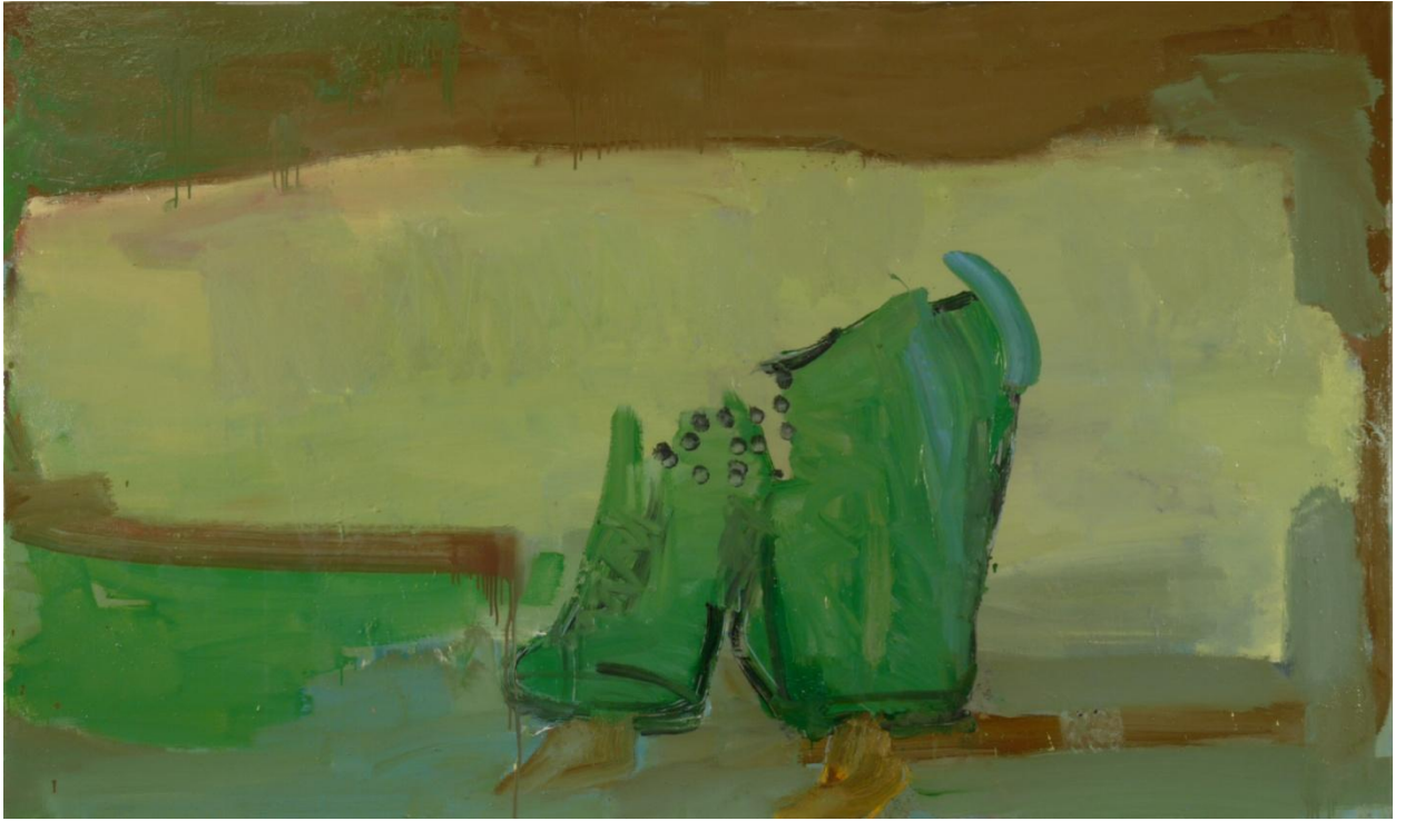
Hans Maas, „Bodenhaftung“, 130 x 220 cm, 2007