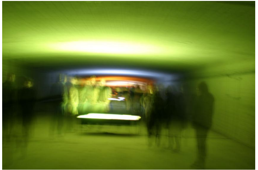
Kurt Ebbers , Installationsfoto aus der Deutzer Brücke 2003, DRITTES UFER“