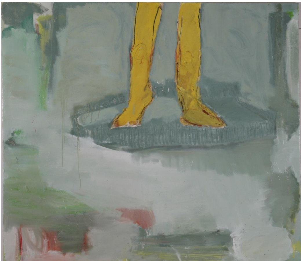
Hans Maas, „Bodenhaftung.“, 140 x 170 cm 2007